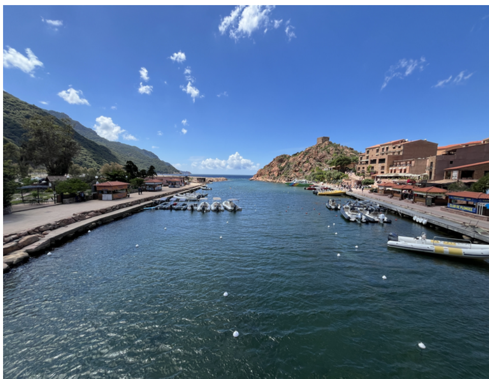
Port de Porto (photo extraite de notre circuit 2024)